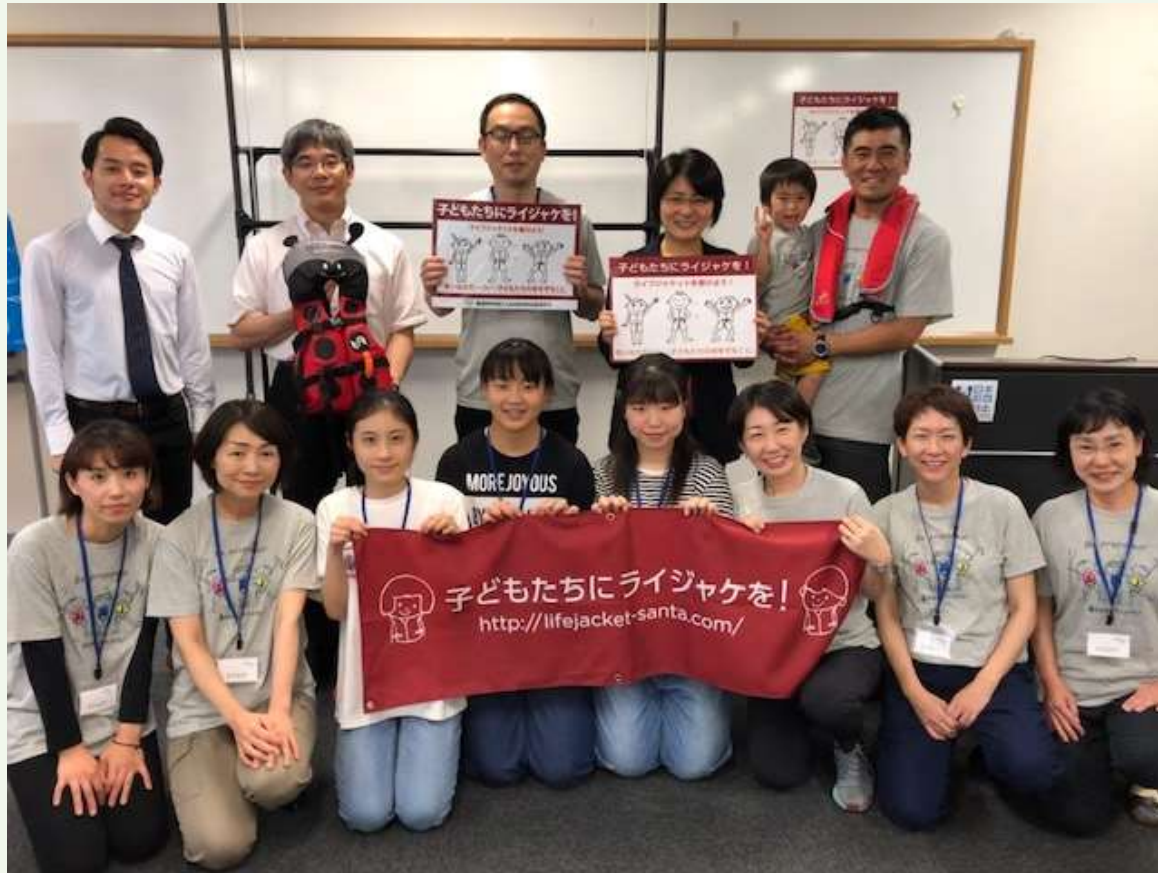
ボランティアでお手伝いしてくれた高校生と。

吉川慎之介記念基金主催 西条市、Love&Safetyさいじょう共催 2019年7月20日