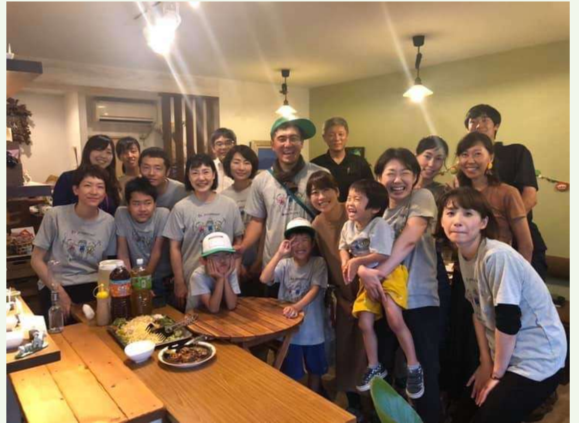
セミナー後、西条市民活動支援センターと共催でお話会も開催