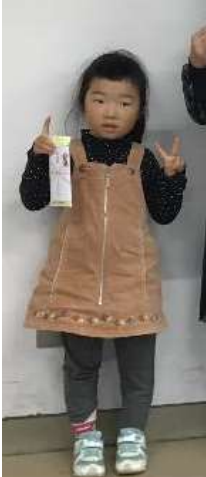
得意分野で副賞を獲得