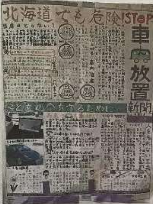
三女の閉じ込め事故の翌年に長女と次女が作った「STOP! 車内放置新聞」の母親提供

その夏、小学生だった女(12)と次女(10)は「母にたいに苦しむ子どもがほしくない」との思いから、車内の閉じ込め事故に注意を呼びかける「STOP! 車内放置新聞」を立ち上げた。母親も手伝って、道内のコンクールで募集した。母親も手伝って、夏休みに外気温と密を比べ、保育所で児童の点